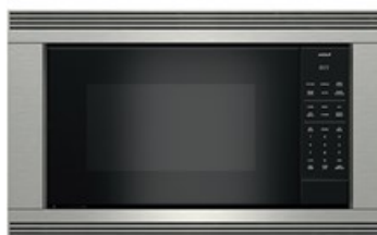
E SERIES STAINLESS